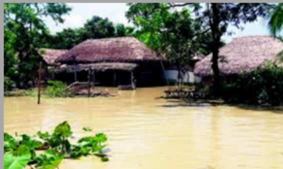
Rajbiraj – 12 augustus

De kinderen vinden samen met hun ouders onderdak in tijdelijke tenten langs de weg... Slachtoffers melden dat kinderen in Dalit-nederzettingen geen eten hadden en geen kleren om te dragen. Zij klaagden dat de overheid